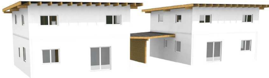
Erdgeschoss 60,28m 2